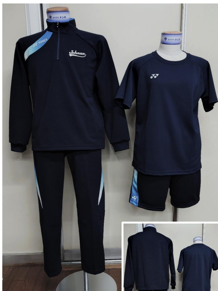
▲ 新体育着の前面 同じくその背面 ▶